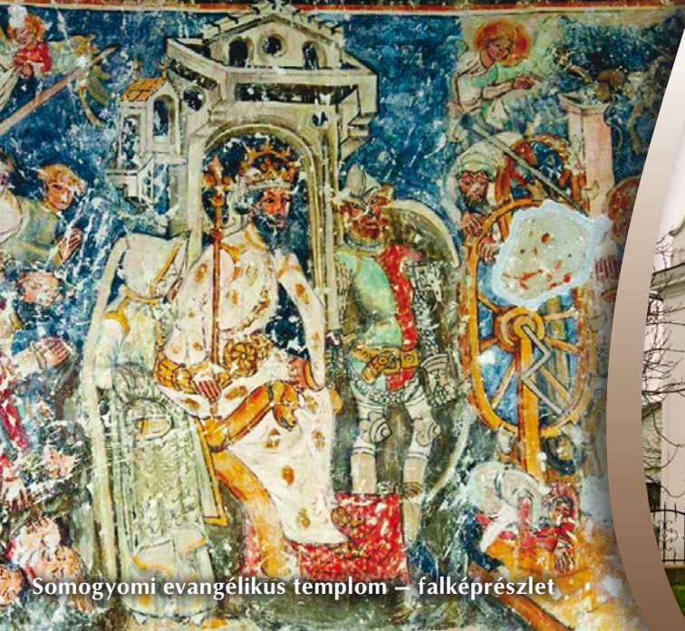
Somogyomi evangélikus templom – falképrészlet