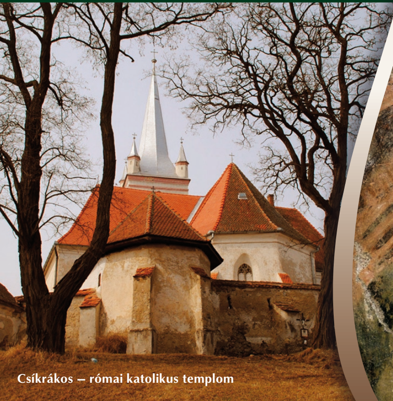
Csíkrákos – római katolikus templom