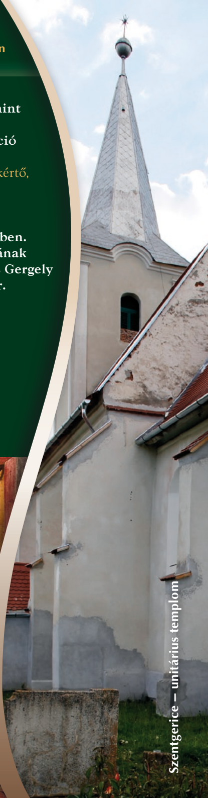
Szentgerice – unitárius templom

A díjat átadja Gulyás Gergely Miniszterelnökséget vezető miniszter