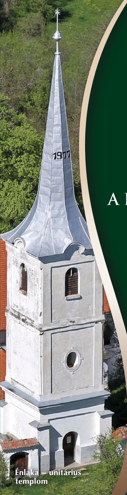
Énlaka – unitárius templom