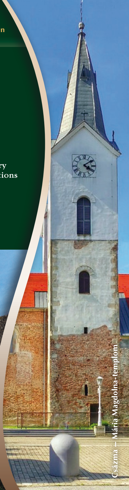
Csázma — Mária Magdolna-templom