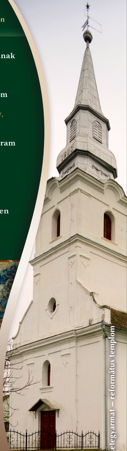
Feketegyarmat – református templom