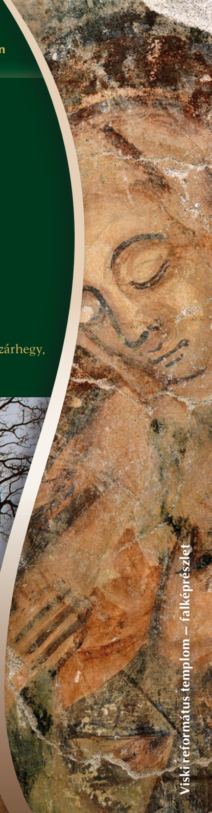
Viski református templom – falképrészlet